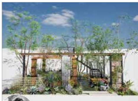
The Connect Garden - 人と人、人と自然をつなぐ庭 -