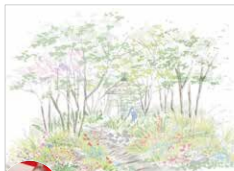
A Garden Where Kindness Blooms - やさしさの芽吹く庭 -