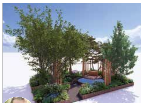
The Spirit of the Forest - 森のスピリット -