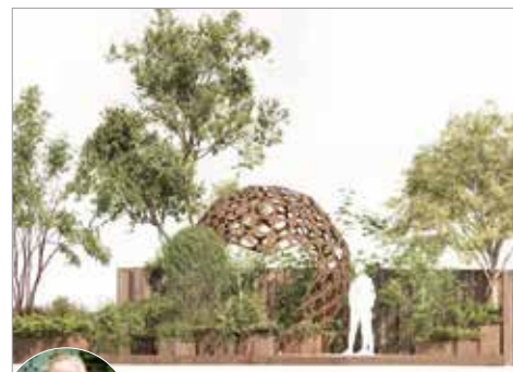
C60 Carbon Garden : A Fusion of Science and Serenity - C60カーボンガーデン: 科学と静寂の融合 -